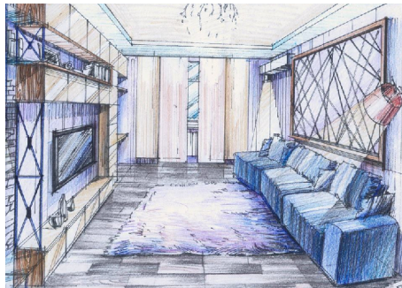
Рис. 3 Скетч як швидкий малюнок дизайну інтер'єру

Скетчі сьогодні в тренді, і кожен дизайнер інтер'єру просто повинен мати у своєму портфоліо набір графічних робіт, що свідчить про його професіоналізм.