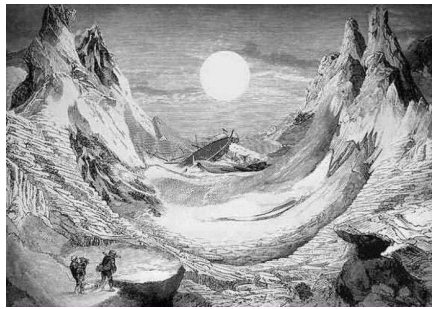
Рис. 2 Скетч як швидкий малюнок пейзажу

Скетчинг здебільшого трактують як швидкий малюнок пейзажу, різних об'єктів, людей, предметів одягу, інтер'єру. Останнім часом він надзвичайно популярний серед архітекторів і дизайнерів інтер'єру. Звернення до такої техніки зумовлено тим, що останнім часом важко когось здивувати можливостями дигітальних технік (Photoshop і 3DMax), що спричинило ностальгію за “живим малюнком із натури”, тяжіння до так званого “handmade”, тобто створеного власними руками.