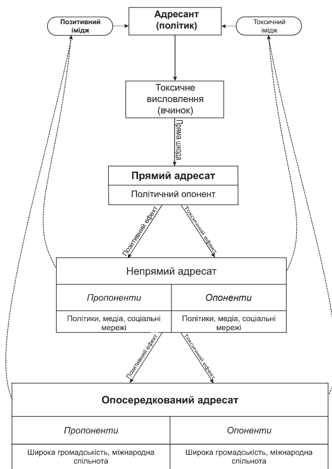
Рис. 1. Мультимодальна модель токсичної політичної комунікації

(опонентів) й сприймаються ним як токсичні; 2) позитивному, якщо його ганьблivi висловлювання та / або вчинки, які свідчать про здатність свого лідера до боротьби за допомогою мови ворожнечі, імпонують прямому, непрямому та опосередкованому адресатові (пропонентів) й сприймаються ним як позитивні.