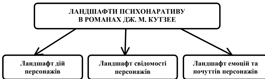
Рис. 1 Ландшафтна модель психонаративу в романах Дж. М. Кутзее

Розглянемо деякі особливості вербальної маніфестації ландшафтної моделі на прикладі роману Дж. М. Кутзее “Slow Man” (“Повільна людина”), де провідною є тема самотності й відчайдушної боротьби людини зі своєю долею. Головного героя роману, шістдесятирічного фотографа Пола Реймента, по дорозі до супермаркету збиває машина. Він потрапляє до лікарні, де йому ампутують частину ноги. Пол повертається додому і стає повністю залежним від сторонніх людей. Цей трагічний випадок докорінно змінює життя і світосприйняття чоловіка, наприклад (виділення жирним тут і далі наше – Н. І.):